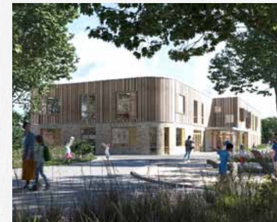
Toekomstige school De Wissel

De voorgaande jaren hebben we veel op papier gezet; nu worden plannen uitgevoerd. We zetten veel in op woningen. Dat is niet altijd eenvoudig te realiseren. Het verandert de leefomgeving van mensen en wekt soms weerstand op. Ook de scholen krijgen veel aandacht. In Gendringen moet de nieuwe er eind 2024 staan en voor Silvolde vorderen de plannen voor een nieuw Integraal Kind Centrum (IKC). Verder wordt er hard gewerkt aan het vereenvoudigen van aanvragen voor diverse regelingen. Niet alleen stenen zijn belangrijk, maar u ook. We willen graag een leefbare gemeente blijven waar het goed en veilig wonen en werken is. Waar we elkaar nog een goede dag toewensen als we elkaar tegenkomen. Daar werken we als gemeenteraad, college en ambtenaren elke dag hard aan.