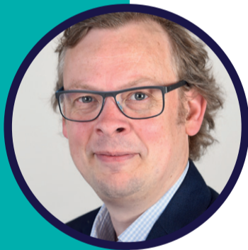
Camiel Vanderhoeven, fractievoorzitter D66